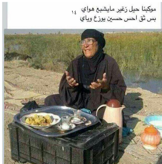
موکبنا حیل زغیر مایشیع هوای بس ثق احس حسین یوزع ویای ۱۴

موکب‌ها گاه خیلی کوچک و خاص هستند، مثل پیرزنی که با یک فلاکس کنار جاده نشسته و چای توزیع می‌کند و یا کودکی که با یک پارچ و لیوان آب توزیع می‌کند.