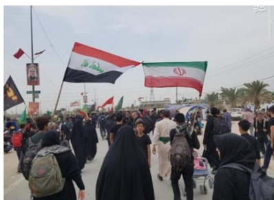
تصویر ۳: پرچم ها و نمادها ۱۶

نقاشی امام حسین (ع)، حضرت عباس (ع)، بدن تیرخورده و پاره پاره و خونین، مشک پاره، حضرت علی اصغر (ع) و اسراء در مسیر دیده می شود. زائران نیز نمادهایی با خود دارند از جمله سربندهایی که حاوی شعارهای حماسی یا توسل به ائمه (ع) می باشد؛ پرچم هایی با شعارهای یا حسین و یا مهدی و ... و یا پرچم کشورهایشان، و کوله نوشته هایی که آن ها نیز دارای مضامین مذهبی و حماسی هستند. برخی از زائران نیز عکس شهیدی را با خود حمل می کنند و نیت کرده اند که به نیابت از آن شهید پیاده به کربلا بروند.